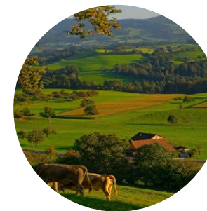
TERRES AGRICOLES & CORPS DE FERME