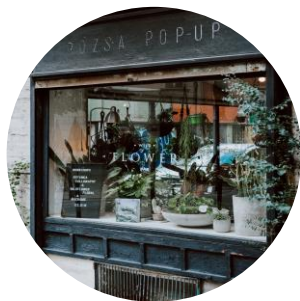
IMMEUBLES À USAGE MIXTE DE COMMERCE ET D'HABITATION